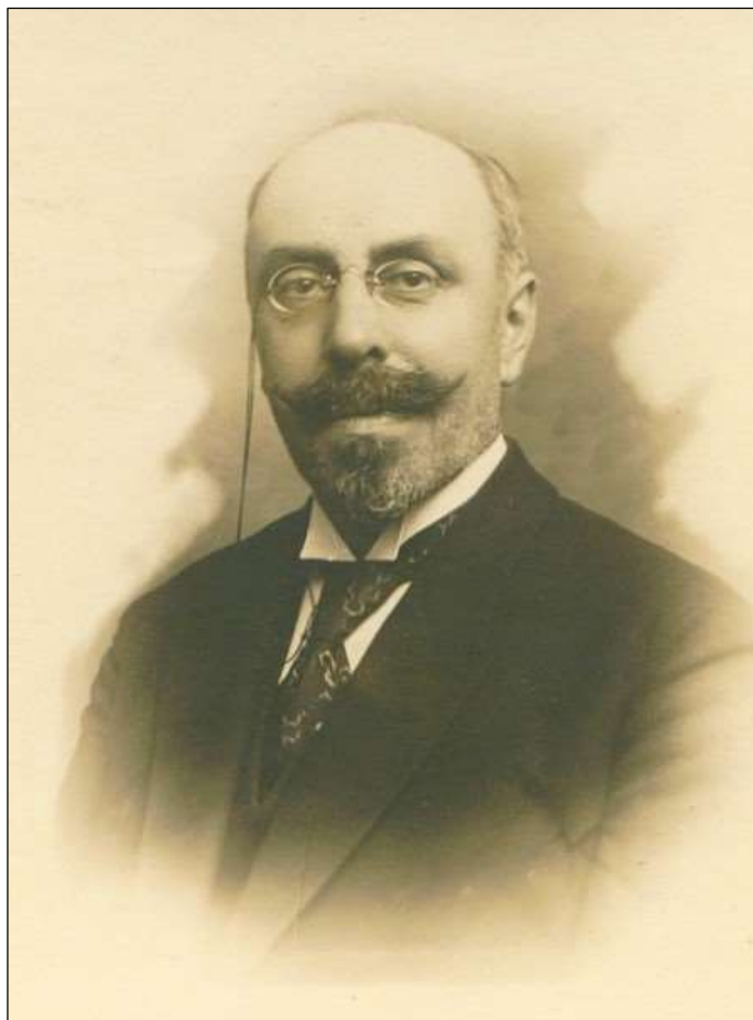
Aleksander Maciesza (1875–1945), zasłużony prezes Towarzystwa Naukowego Płockiego w latach 1907–1945.