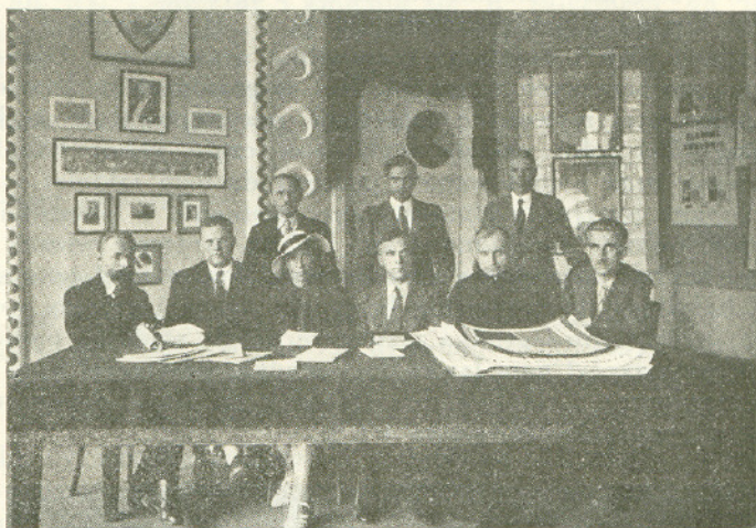
Komitet Organizacyjny Wystawy i Kursów Przeciwalkoholowych.

8 czerwca 1935 roku Ogólną Polską Wystawę Przeciwalkoholową w Płocku oraz trzydniowe kursy dla instruktorów przeciwalkoholowych. Kursy te ukończyło około 30 osób, poczem przystąpiono do zorganizowania Towarzystwa „Trzeźwość“, jako podsekcji Towarzystwa Higienicznego. Celem tego Towarzystwa jest propaganda trzeźwości. Towarzystwo „Trzeźwość“ posiada własną świetlicę w „Ośrodku Zdrowia“, gdzie odbywają się zebrania propa-