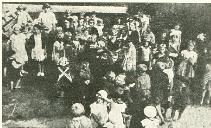
Dzieci w Ogródku.

Projekt ten jednak nie uzyskał aprobaty Urzędu Zdrowia Województwa Warszawskiego, wobec czego brak publicznych kąpielisk, a zwłaszcza kąpieliska sanitarnego, dotychczas w Płocku w tej czy innej formie nie został usunięty.