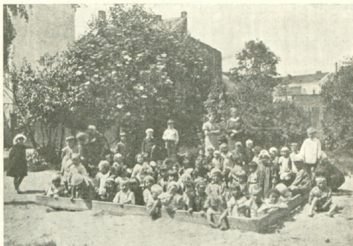
Okupacja piaskarni przed nawiezieniem piasku.

W roku 1934 sezon zabaw w Ogródku trwał od 1 czerwca do 4 października, a więc przez 4 miesiące i 4 dni. W roku 1935 zabawy rozpoczęły się również dnia 1 czerwca i trwały do dnia 26 września t. j. do czasu, gdy liczba dzieci uczęszczających do Ogródka spadła z powodu zimnych i słotnych dni do 30 dziennie. Wreszcie w roku 1936 otwarto Ogródek dnia 10 maja, a zabawy trwały do dnia 1 października.