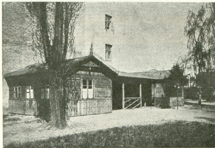
Pawilon w Ogródku Jordanońskim. W lewym skrzydle mieści się kuchnia, spiżarnia, natryski, rozbieralnia i klozety, w prawym — kancelaria.