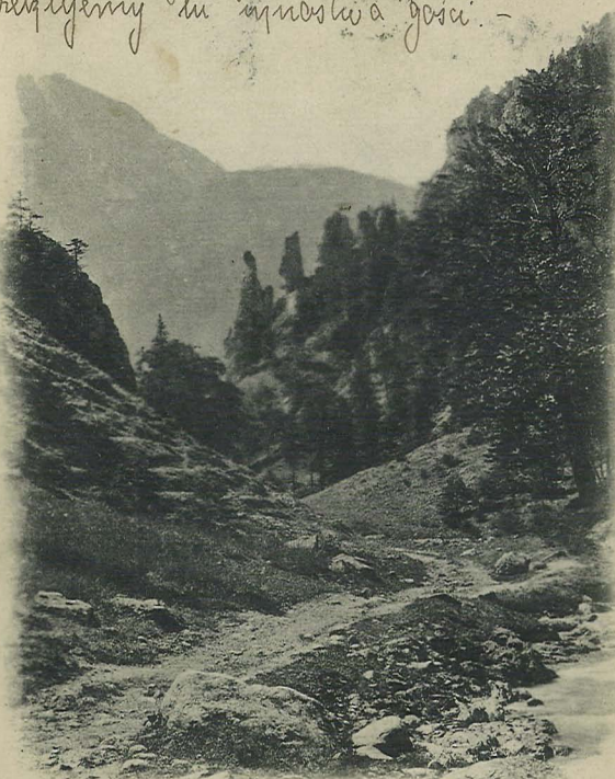
Tatry. Kominy w Strażyskach.

ci srokawa tyko, ze los, puzkora Zabrae milego namy profesora - - 7. 44.