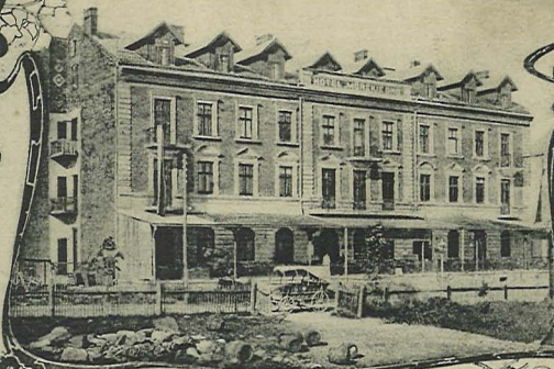
Hôtel „Morskie oko” Zakopane.