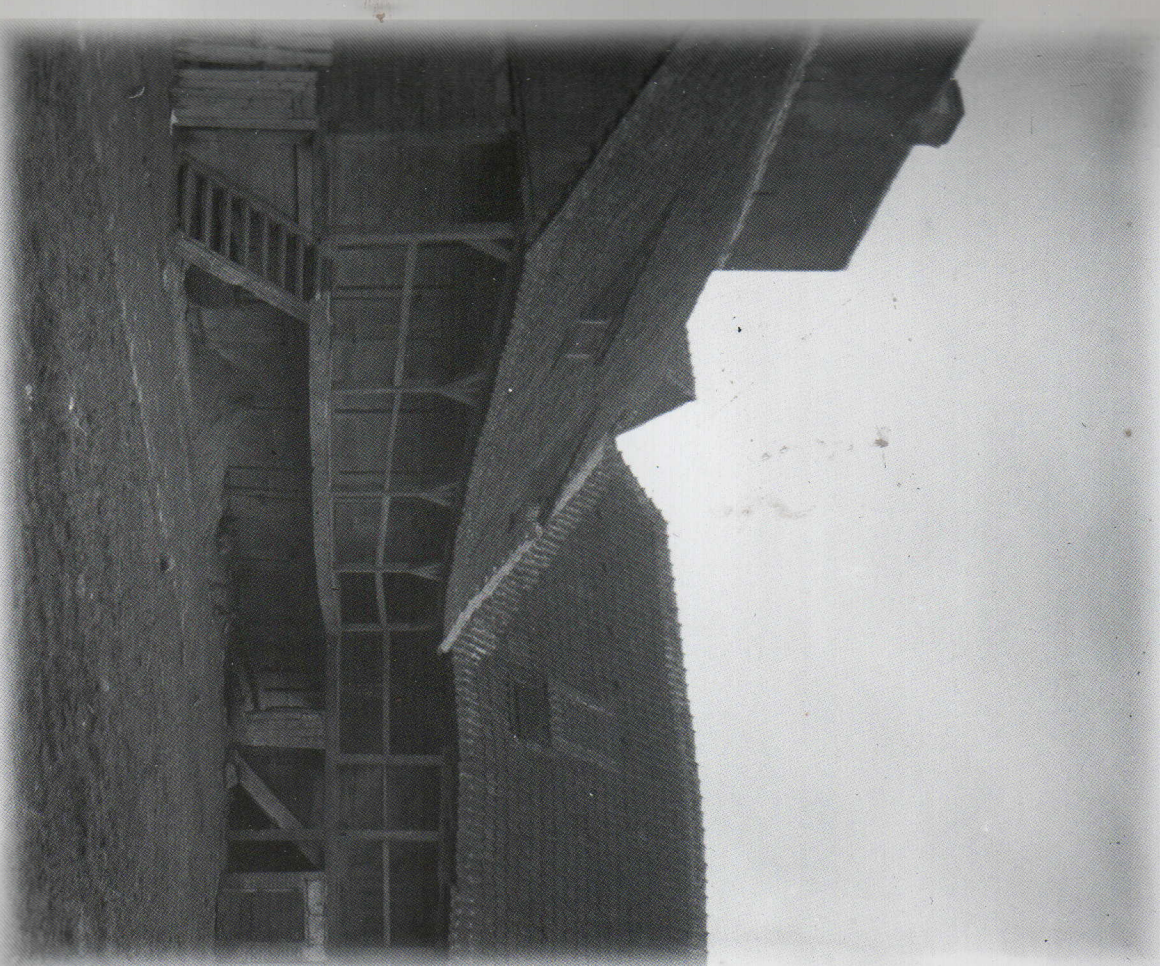
Drewniane spichlerze przy ul. Piekarskiej, przed 1920 r.