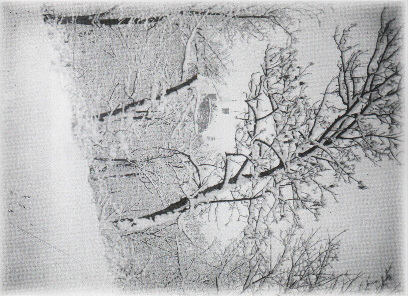
Widok na katedrę płocką zimą, lata 1920