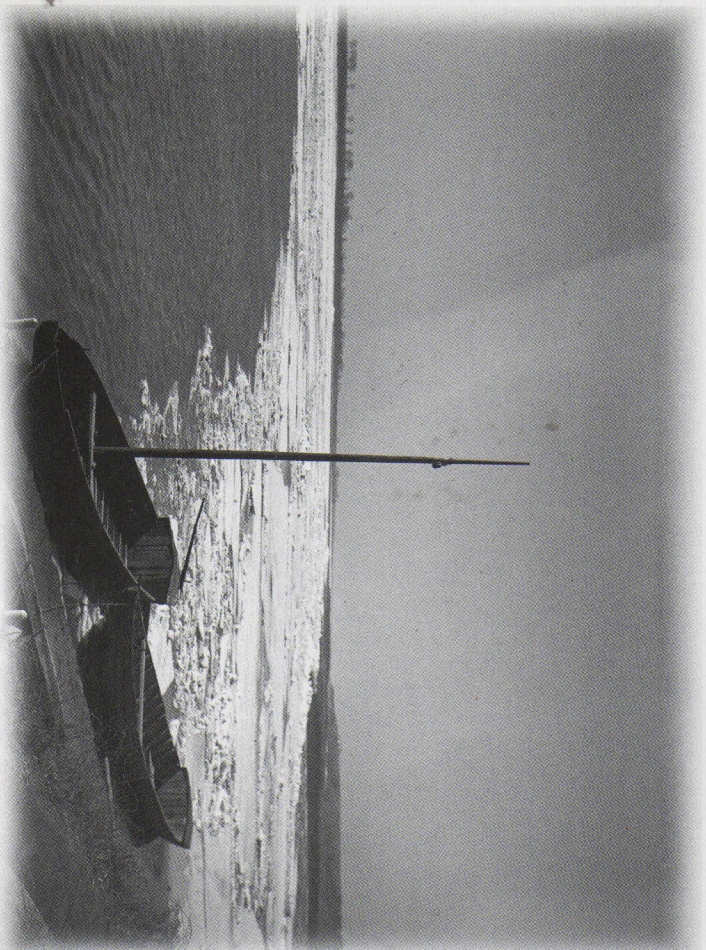
Łódzie przycumowane do brzegu Wisły, lata 1930