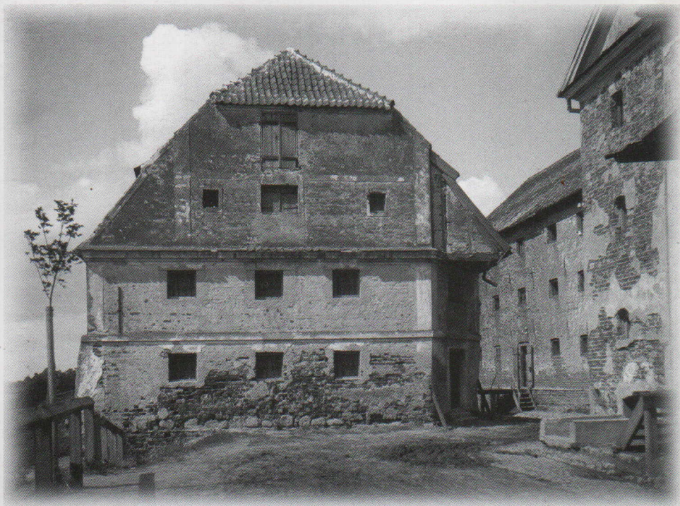
Spichlerze za kościołem farnym w Płocku, ok.1930 r.