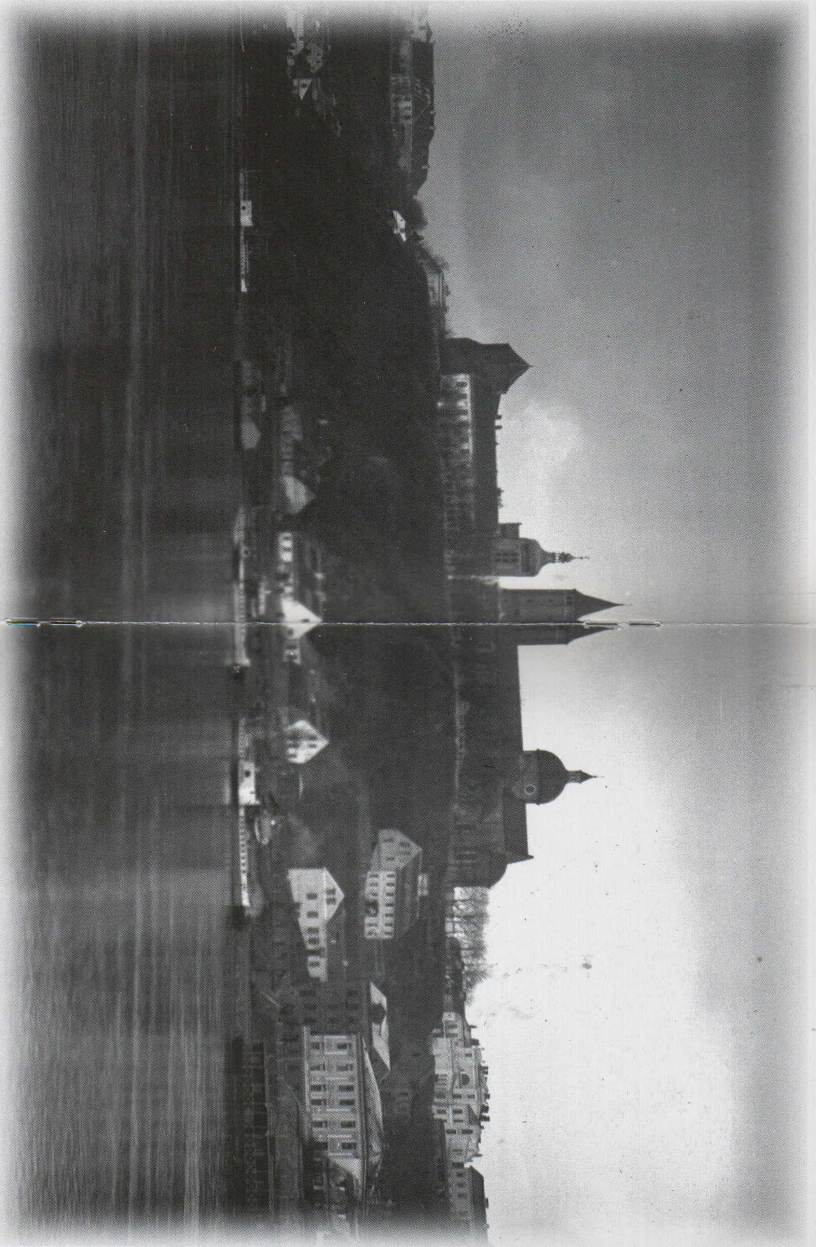
Panorama Płocka od strony Wisły, ok. 1910 r.