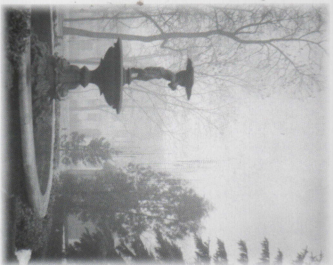
Fontanna na Placu Floriańskim we mgle, lata 1920