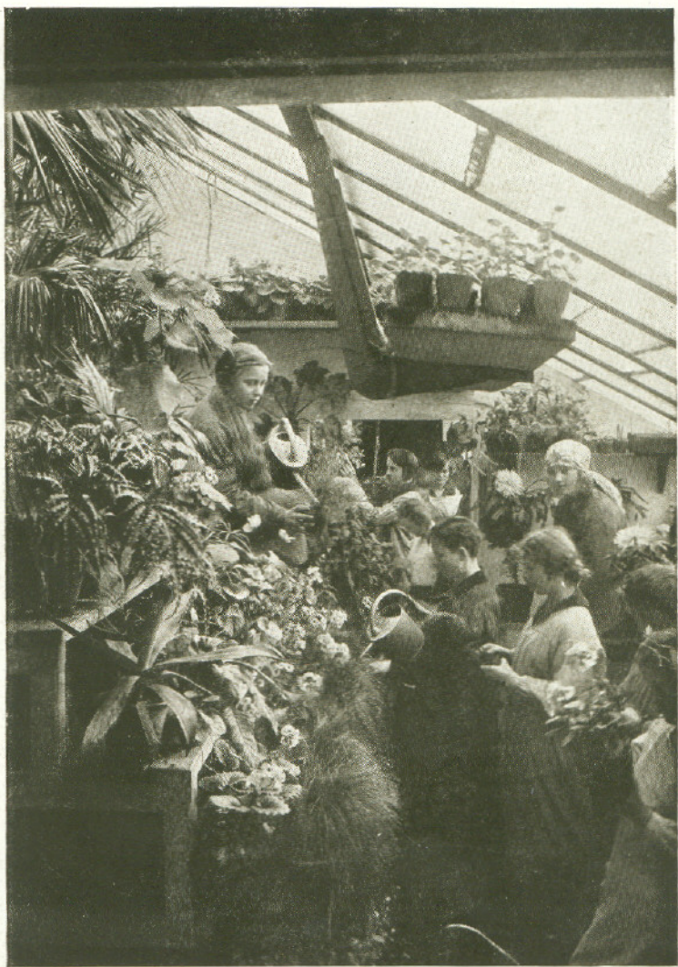
ZAJĘCIA W CIEPLARNI.