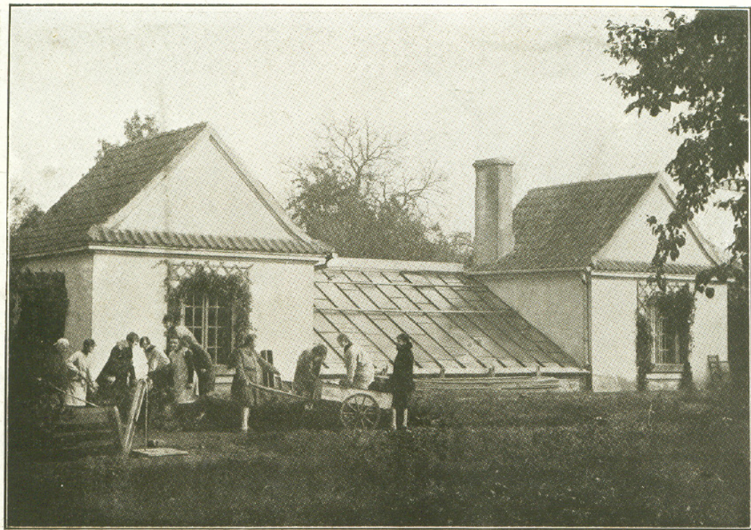
ZAJĘCIA W INSPEKTACH.