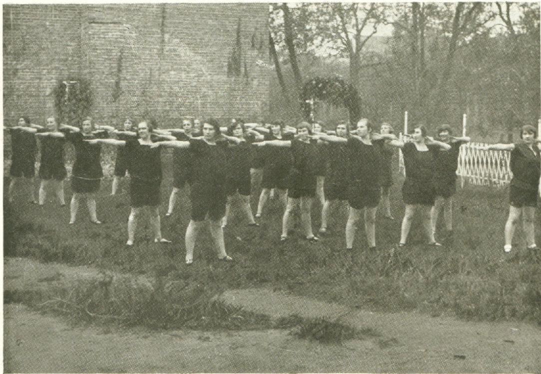
GIMNASTYKA W OGRODZIE.