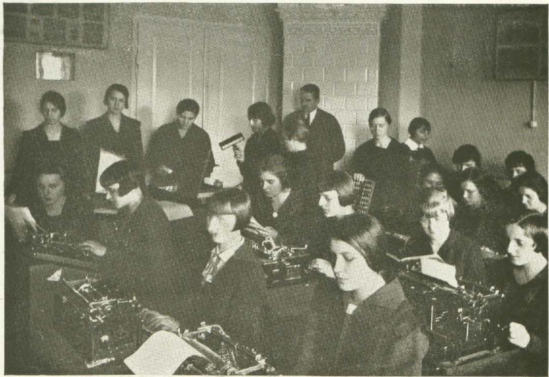
PRACA PRZY MASZYNACH DO PISANIA I POWIELACZACH.